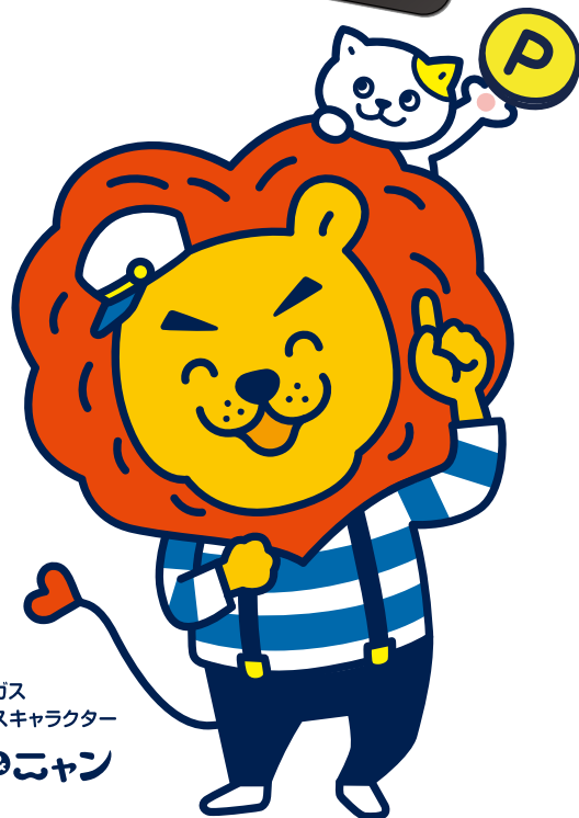
日本海ガス くらし快適サービスキャラクター エガオ-ヤン